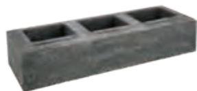
Long Abschlussstein 1 1/2