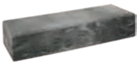
Long LED-Stein 1 1/2